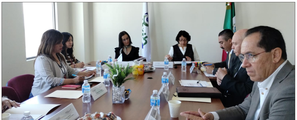
▲ En el país, las administraciones públicas estatales recibieron un total de 390 mil 22 solicitudes en materia de acceso a la información pública y de protección de datos personales.

posición con una cifra similar a Hidalgo, recibió 2 mil 324 solicitudes de información pública y de protección de datos personales y contestó 2 mil 310.