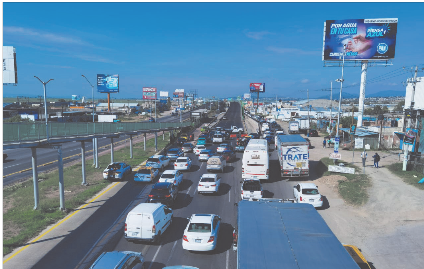
▲ Tras las diversas agresiones y atentados que han sido víctimas operadores de la empresa de transporte México-Tizayuca, ayer los inconformes realizaron diversos bloqueos en los accesos a la capital del país y el Estado de México. La policía estatal cerró la circulación a la autopista México-Pachuca, a la altura del distribuidor vial de Téllez.