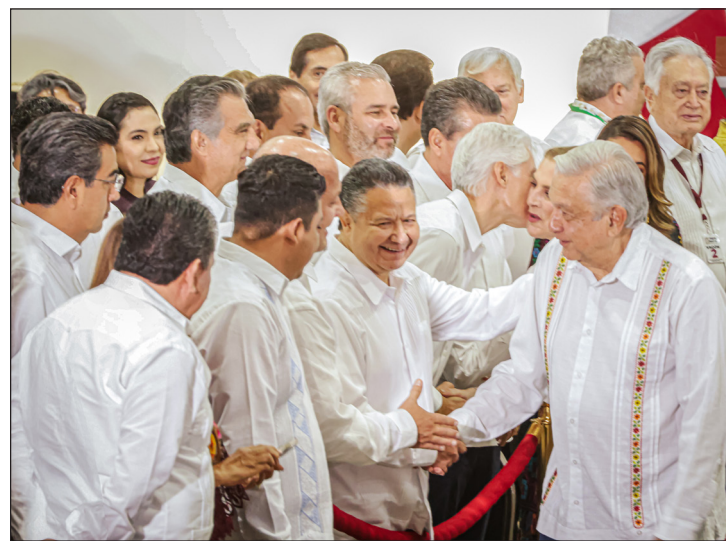
▲ El gobernador Julio Menchaca recordó que la entidad ha sido beneficiada con políticas públicas de visión social.

Además, recordó que Hidalgo ha recibido en cinco ocasiones al presidente “y en cada una de ellas con grandes anuncios que garantizan el bienestar de las y los hidalguenses, así como del pueblo de México”, puntualizó el gobernador.